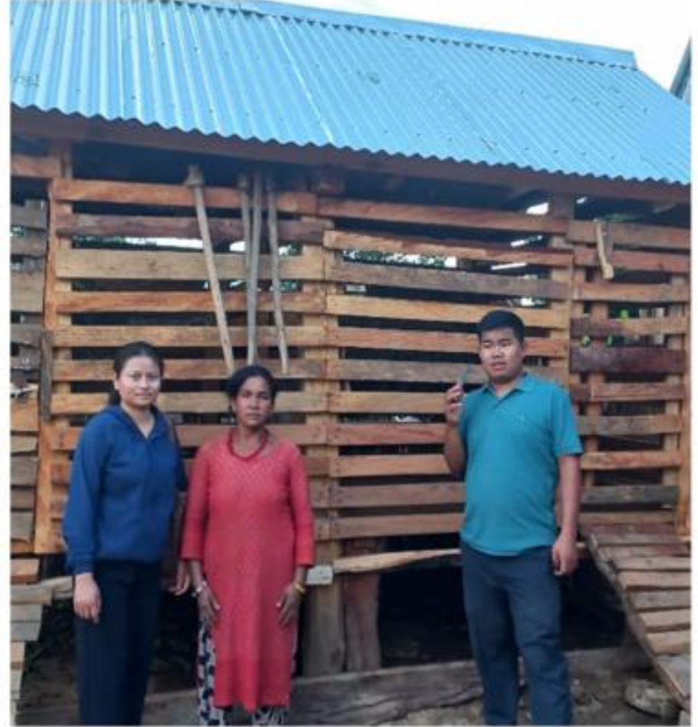
फोटो: बाखा पालन प्रर्पद्धन कार्यक्रम अन्तर्गत खोर निर्माण अवलोकन ।