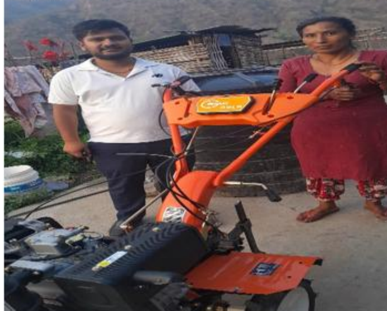
चित्र नं १ गोलन्जोर गाउँपालिका कृषि विकास शाखाबाट वितरण गरिएको डिजेल इन्जिनको अनुगमन