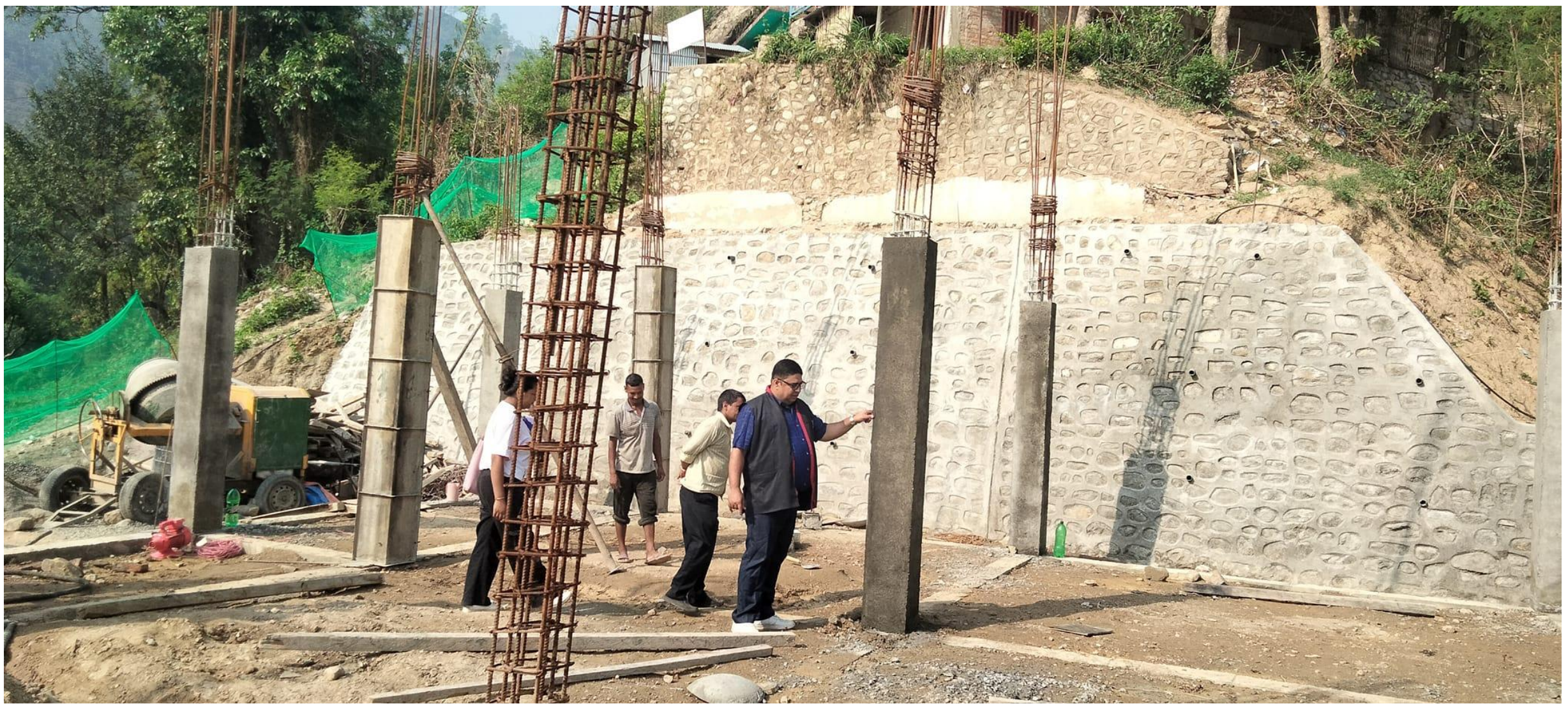
गोलन्जोर गाउँपालिकाद्वारा योजना तर्फ भवन अनुगमन